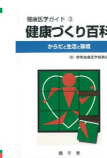
健康医学ガイド3 健康づくり百科 からだと生活と環境 平成8年6月20日発刊