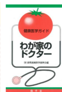
健康医学ガイド2 わが家のドクター 平成5年7月25日発刊