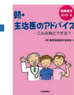
健康医学ガイド4 続・主治医のアドバイス —こんな時どうする？— 平成13年4月14日発刊