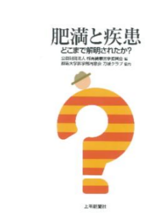
健康医学ガイド6 肥満と疾患—どこまで 解明されたか？— 平成29年8月15日発刊