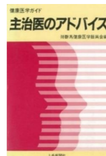
健康医学ガイド1 主治医のアドバイス 平成元年4月10日発刊

概ね5年毎に法人が収集した最新の医療情報や医学の進歩について、広く県民、地域住民に知って頂くための書籍“健康医学ガイド”シリーズを発刊します。書籍は閲覧用として賛助会員、地域の医師会、病院、学校施設、行政などに無償頒布します。平成元年4月に「健康医学ガイド1 主治医のアドバイス」を発刊後、これまでに下記タイトルで6冊を出版しました。第6刊“肥満と疾患：どこまで解明されたか？”は、現在在庫があります。ご入用の方は当財団事務局までご連絡ください。なお、“健康医学ガイド7 循環器病～知る・治す・予防する～”を令和4年度発刊予定のため現在編集委員会を中心に作業を行っています。